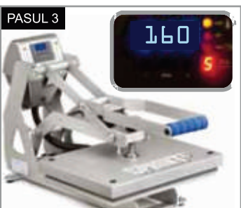
PASUL 3 Presăși timp de 5 secunde la 160°C cu presiune medie. Îndepărtați suportul când acesta este cald.