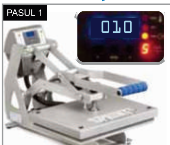
PASUL 1 Presăși materialul pe care doriți să îl inscripționați timp de 3-5 secunde la 160°C pentru a îndepărta culele sau umezeala.