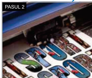
PASUL 2 Imaginea poate fi tăiată pe contur, imediat după printare.