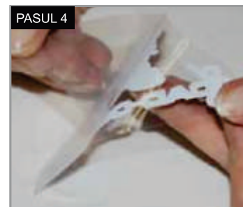
PASUL 4 Îndepărtați materialul suport, înainte de a face transferul pe textil.