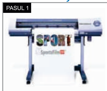
PASUL 1 Poziționați folia în printer. Asigurați-vă că suprafața printabilă a materialului este poziționată cu fața în sus. Printați imaginea.