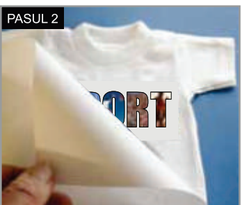
PASUL 2 Aplicați imaginea pe textil cu suportul în sus și acoperiți-o cu hârtie de protecție sau cu folie de teflon.