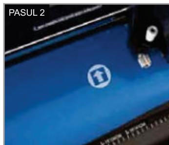
Întotdeauna faceți un test de tăiere înainte pentru a verifica presiunea, viteza și cât de ascuțit este cuțitul.