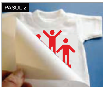
Aplicați imaginea pe textil cu suportul în sus și acoperiți-o cu hârtie de protecție sau cu folie de teflon.