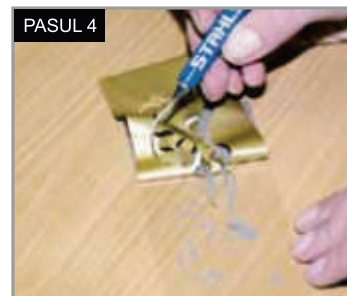
Îndepărtați întotdeauna excesul de material, lăsând doar imaginea dorită pe suport.