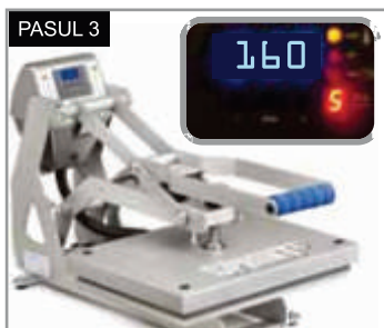
Presăși timp de 5 secunde la 160°C cu presiune medie. Îndepărtați suportul după ce s-a răcit.