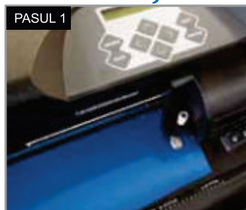
Poziționați folia în cutter plotter, cu materialul suport în partea de jos.