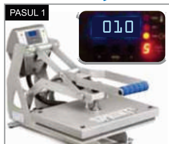
Presăși materialul pe care doriți să îl inscripționați timp de 3-5 secunde la 160°C pentru a îndepărta culele sau umezeala.