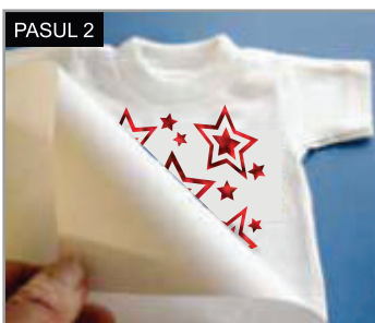
Aplică imaginea pe textil cu suportul în sus și acoper-o cu hârtie de protecție sau cu cu folie de teflon.