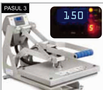
Presează timp de 10 sec la 150°C cu presiune medie. Îndepărtează suportul după ce s-a răcit.