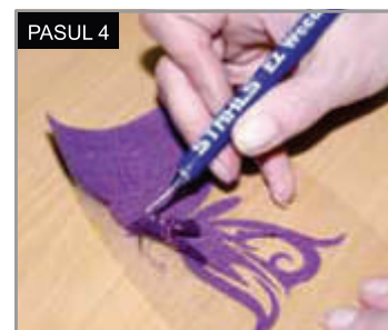
Îndepărtează întotdeauna excesul de material. Lasă doar imaginea dorită pe suport.