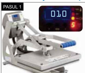
Presează materialul pe care dorești să îl inscripționezi timp de 3-5 sec. la 150°C pentru a îndepărta cutele și umezeala.