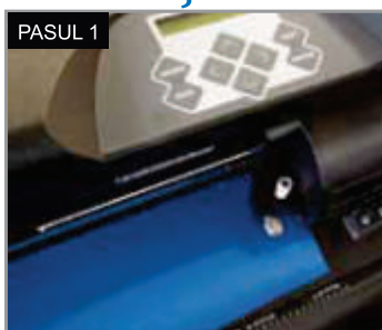
Poziționează folia în cutter plotter cu materialul suport în jos.